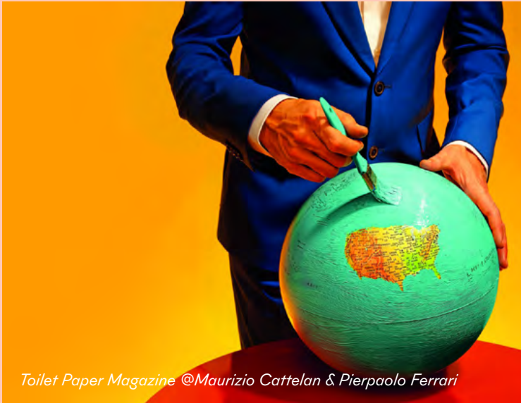
Toilet Paper Magazine @Maurizio Cattelan & Pierpaolo Ferrari