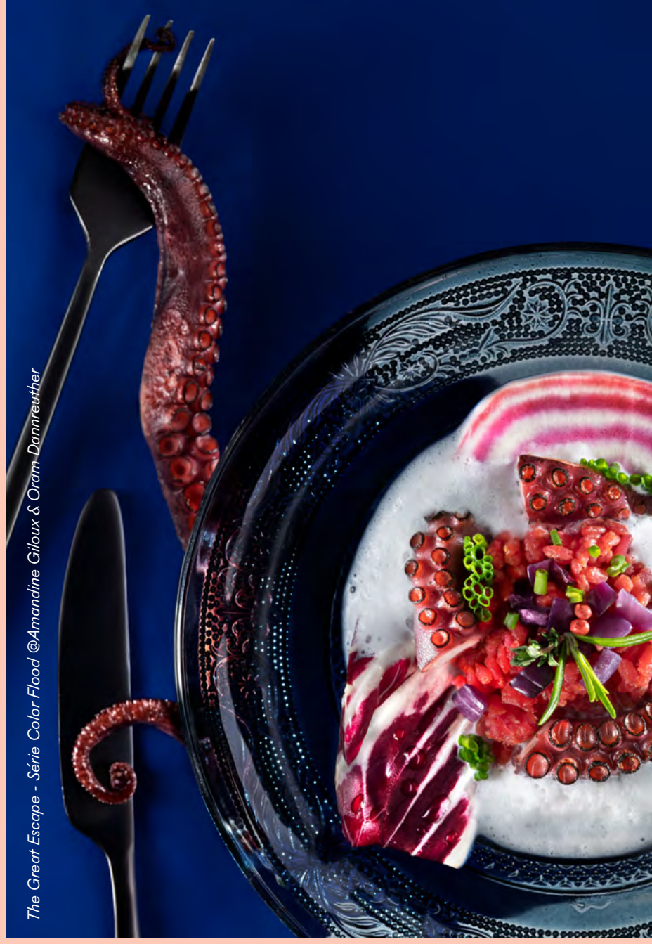
The Great Escape - Série Color Flood