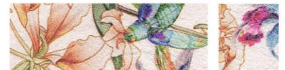
JASMIN Cuir de vachette Cuir de vachette