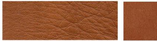
NOISETTE Cuir de vachette Veau velours