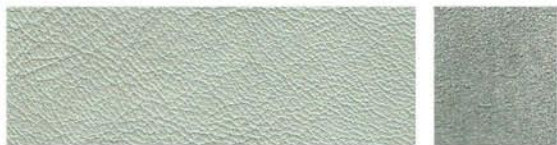
VITRE Cuir de vachette Veau velours