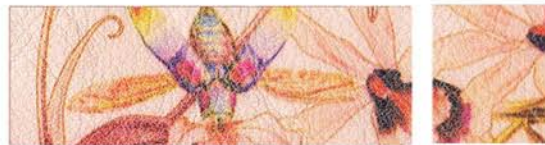
CAPUCINE Cuir de vachette Cuir de vachette