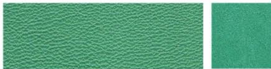
VERT Cuir de vachette Veau velours