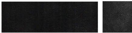
NOIR Cuir de vachette Veau velours