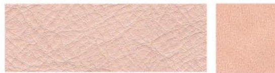
NUDE Cuir de vachette Veau velours