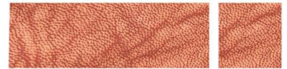
PATCHOULI Cuir de chèvre Cuir de chèvre