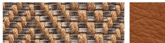
PISÉ Tressage textile Cuir de vachette