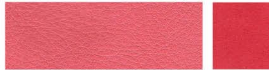
PINK Poils de vachette Veau velours