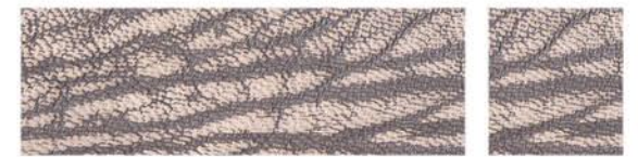
GRANITE Cuir de chèvre Cuir de chèvre