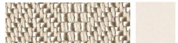
ARGILE Tressage textile Cuir de vachette