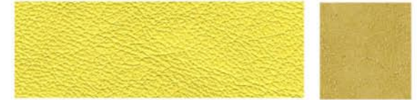
CYBER Cuir de vachette Veau velours