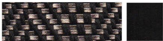
MAGMA Tressage textile Cuir de vachette