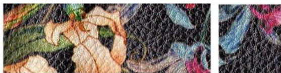
DAHLIA Cuir de vachette Cuir de vachette